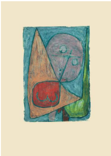
Paul Klee, Engel, noch weiblich, 1939, 1016, Kreide auf Grundierung auf Papier auf Karton, 41,7 x 29,4 cm, Zentrum Paul Klee, Bern

Die Veranstaltungsreihe im Kunstmuseum Bern und im Zentrum Paul Klee lädt ein zum Dialog zwischen Glaube und Kunst. Bildbetrachtungen vor ausgewählten Werken bieten Raum zum Nachdenken über religiöse Bildinhalte und gesellschaftlich relevante Themen. Eine gemeinsame Gesprächsreihe von Kunstmuseum Bern, den drei Landeskirchen sowie (neu ab 2016) dem Zentrum Paul Klee und dem Haus der Religionen.