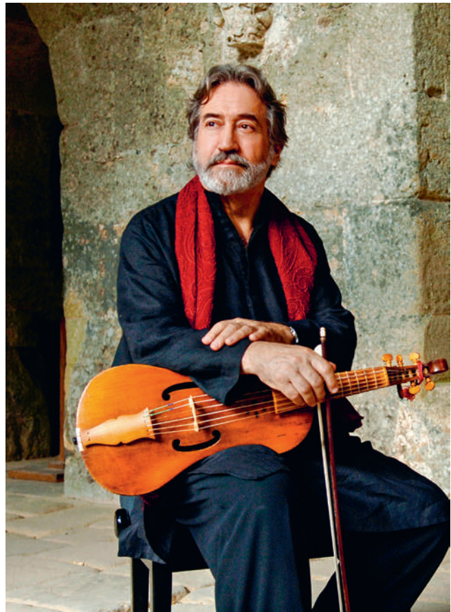
Jordi Savall