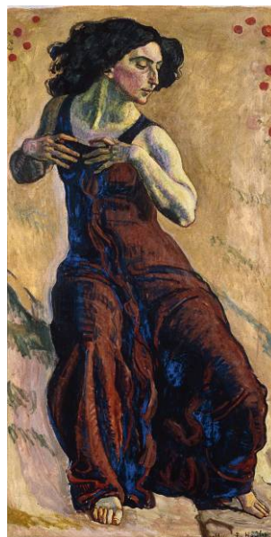
BILD 10 Ferdinand Hodler Entzücktes Weib , 1911 Öl auf Leinwand 170 × 85,5 cm Privatsammlung