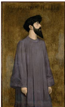
BILD 9 Alexandre Séon Sâr Joséphin Péladan , 1891 Öl auf Leinwand 132,5 × 80 cm Musée des Beaux-Arts de Lyon