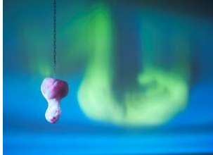
BILD 13 František Klossner Intervall vital , Videoinstallation, 1991 Selbstportrait in Eis, Wasserfläche, Single-Channel Projektion Im Besitz des Künstlers