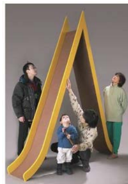
BILD 19 Natsuko Tamba Wyder o. T. , 2002 Metall 260 x 215 x 41,5cm Im Besitz der Künstlerin