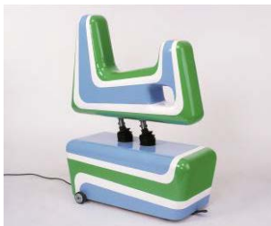
BILD 17 Sabina Lang/Daniel Baumann Childish Behavior #3 , 2000 Motor, Stahl, Styropor, Glasfaser, Epoxidharz, Lack 110 x 80 x 40 cm Im Besitz der Künstler