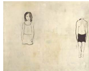
BILD 16 Kotscha Reist Ook samenhangend , 1995 Öl auf Leinwand 130 x 170 cm Im Besitz des Künstlers