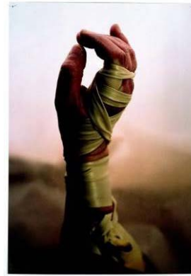
BILD 14 Esther van der Bie Nature morte , 1994 Farbphotographie 110 x 76,5 cm Kunstmuseum Bern, Bernische Stiftung für Foto, Film und Video, Bern