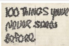
James Lee Byars JLB an Toni Gerber, Postkarte, 1975 Schrift mit Sternchen, schwarzer Filzstift auf Postkarte 15,5 x 10,0 cm Kunstmuseum Bern, Sammlung Toni Gerber (Schenkung) © Estate of James Lee Byars