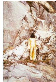
James Lee Byars A Drop of Black Perfume, 1983 Furkapass © Estate of James Lee Byars