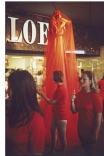
James Lee Byars The First International Perfume Exhibition, 1972 Warenhaus Loeb, Bern Archiv Harald Szeemann © Photo: Balthasar Burkhard © Estate of James Lee Byars