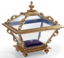
James Lee Byars Autobiography alla veneziana, 1986 Glas und vergoldetes Holz, Brotkugel auf Satinkissen 55 x 52 x 42,5 cm Kunstmuseum Bern, Sammlung Toni Gerber © Estate of James Lee Byars