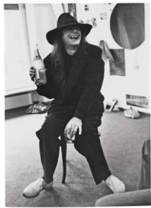
James Lee Byars LETTER SHOW, 1975 Schwarzweissfoto 16,2 x 22,7 cm Kunstmuseum Bern, Sammlung Toni Gerber (Schenkung) © Estate of James Lee Byars

Bestellungen / Ordres / Orders: Christine Weber, christine.weber@kunstmuseumbn.ch , T + 41 (0)31 328 09 53