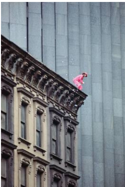
James Lee Byars Realising „0“, 1972 New York