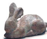
James Lee Byars Gebackener Osterhase, 1975 Bisquitteig, Fett, Puderzucker H 12,4 cm, B 19 cm, T 7 cm Kunstmuseum Bern, Sammlung Toni Gerber (Schenkung)