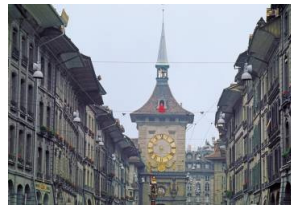
James Lee Byars Calling German Names, 1972 Zeitglockenturm Bern