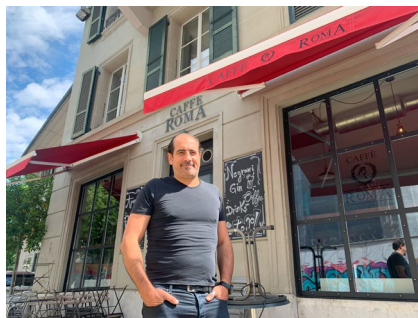
01 Maurizio Piccirilli © Kunstmuseum Bern

Alle Urheberrechte bleiben vorbehalten. Die Bildlegende muss vollständig über- nommen und das Werk wie abgebildet reproduziert werden. Die Bilder dürfen nur im Zusammenhang mit der Bericht- erstattung zum Café Kunstmuseum Bern verwendet werden.