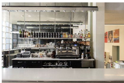
04 Café Kunstmuseum Bern