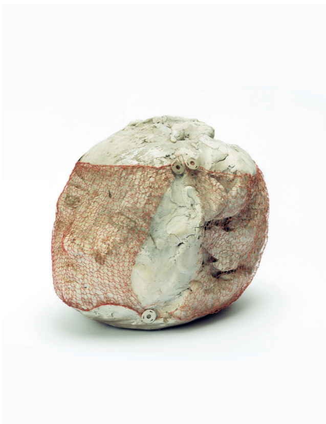
↑ Marisa Merz, Ohne Titel , 1982, Rohnton, Kupferdraht, Reissnägeln, 17 x 16 x 22 cm, Merz Collection

Die Motive, Farben und Kompositionen der Werke von Marisa Merz sind oft ein Echo auf Kunstwerke vergangener Zeiten: von den byzantinischen Ikonen bis zu den