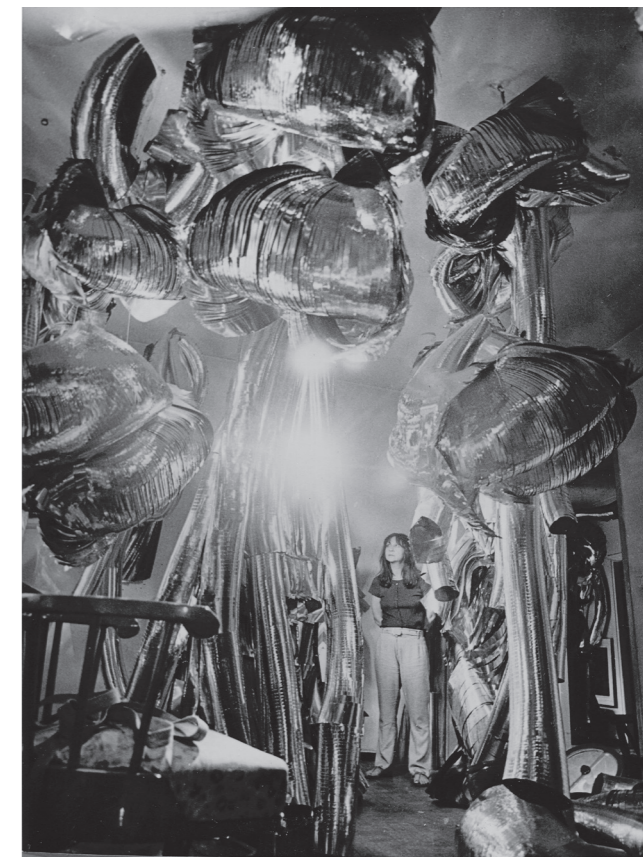
↑ Marisa Merz mit Living Sculpture , Turin, 1967, Merz Collection, Foto: Renato Rinaldi ©2025, ProLitteris, Zurich

Auch im Bereich der Zeichnung erforschte Merz neue Möglichkeiten. Indem sie grosse Papierbögen kombinierte, überschritt sie deren physische Grenzen und schuf Gemäldestücke, die sich in die Tradition der italienischen Freskenmalerei einreihen lassen. Bald füllten die grossformatigen Zeichnungen die Wände ihres Ateliers. Manchmal enthielten sie auch Komponenten anderer Arbeiten, etwa kleine modellierte Köpfe oder Kupferdrähte. Unermüdlich folgte Merz den Eigenschaften des Materials und der Räume. Sie liess immer wieder neue Formen in neuen Kontexten entstehen. Natur und Zeit gestalteten ihre Werke mit. Mit einfachen und alltäglichen Materialien und Techniken schuf sie poetische Werke, die die Betrachter:in einbeziehen. Ihr Werk ist auch in der Spätphase vielschichtig und von grosser Offenheit, was eine Vielfalt an Zugängen und Interpretationen zulässt.