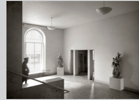
Schon zwanzig Jahre nach der Eröffnung des Gründers wurde diese als nicht mehr ausreichend für die schnell anwachsende Sammlung empfunden. Ab 1932 konnte eine Erweiterung auf der gegen Osten angrenzenden Parzelle in Angriff genommen werden. Der Architekt Karl Indenmühl, der 1933 während der laufenden Bauarbeiten verstarb, und ihm nachfolgend Otto Salvisberg, entwarfen einen neuschwedischen modernen Seitenflügel, der unmittelbar an den Stellerbau anschloss. Der am 23. Februar 1936 eröffnete Bau ist unverzerrt weisse Wände, die im Obergeschoss von Oberlichtern erhellt werden – eine ideale Architektur für die zeitgenössische Moderne, die jedoch erst später der Einzug halten sollte. Stattdessen dominierten zur Entstehungzeit Schweizer Künstler, die mit einem rustikalen Realismus der Zeitgeist der ästhetischen Landesverteidigung huldigten. So wurde ausserdem Bauschmuck ein Sgraffito an der Fassade hin zur Hodlerstrasse mit dem Thema Aplertheim von Cuno Einseit ausgeführt. Berner Künstler, die progressive Strömungen vertritteten, protestierten mit einer nächtlichen Teer-Attacke auf das Sgraffitto.