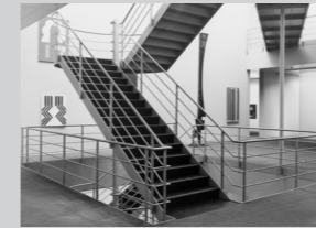
1983 wurde der Erweiterungsbau des Berner Architekturbüros Atelier 5 mit zusätzlichen Flächen für die Sammlung, einen Kino, Büro, Seminar- und Bibliotheksräumen sowie einem Café eröffnet. Das Grundstück liess aus Platzgründen kein drittes Gebäude zu. Der Erweiterungsbau von Indenmühl/Salvisberg wurde mit Ausweitung der Strassenfront abgebrochen. Die Untergeschosse wurden in den Hang an mehrere Stockwerke erweitert. Die ehemalige Strassenfassade, eine geschlossene Mauer, wurde abgetragen und um eine brechenkladete, einfache Stahlfachwerkstruktur ergänzt. Die Bauarbeiten gingen unter der Titel über dem Abschluss umfangreicher performativer Kunst-Aktionen voraus.

In enger Zusammenarbeit mit dem Künstler Rémy Zaugg wurde der gesamte Ausbau mit grosser Zurückhaltung gestaltet, dafür standen der schwarze Fasaden und die graue gestrichelten Wände. Heute kam ein Hängende Konzept, das das Entfernen von historischen Rahmen vorsah. Nichts sollte von den ursprünglichen Konstruktionen abdecken. Bereits 1993 musste der Atelier 5-Bau einer dringenden bautechnischen Sanierung unterzogen werden. Die Renovierung der historischen Treppenhalle im Bestehenden konnte 1999 abgeschlossen werden.