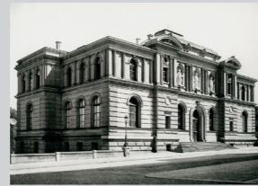
Albert Anker setzte sich 1874 in seiner Funktion als Mitglied des Grossen Rates des Kantons Bern entschieden für den Bau eines Kunstmuseums ein. Als