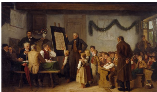
04 Albert Anker L'Examen , 1862 Huile sur toile 103 x 175 cm Kunstmuseum Bern, Staat Bern