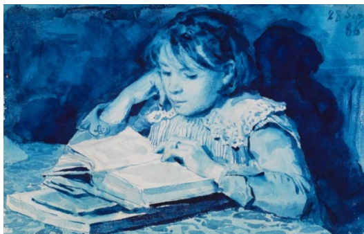
01 Albert Anker Cécile Anker , 28 septembre 1886 Peinture faïence bleue sur papier 16,9 x 23,3 cm Centre Albert Anker, Ins

Tous les droits d'auteur sont réservés. La légende doit être reprise intégralement et l'œuvre doit être reproduite telle qu'elle est présentée. Les photos ne peuvent être utilisées que dans le cadre d'un reportage sur l'exposition Albert Anker. Les filles lisent.