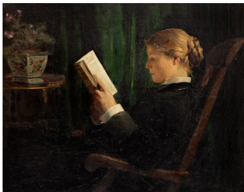
02 Albert Anker La liseuse , 1883 Huile sur toile 94 x 110 cm Musée des Beaux-Arts, Le Locle