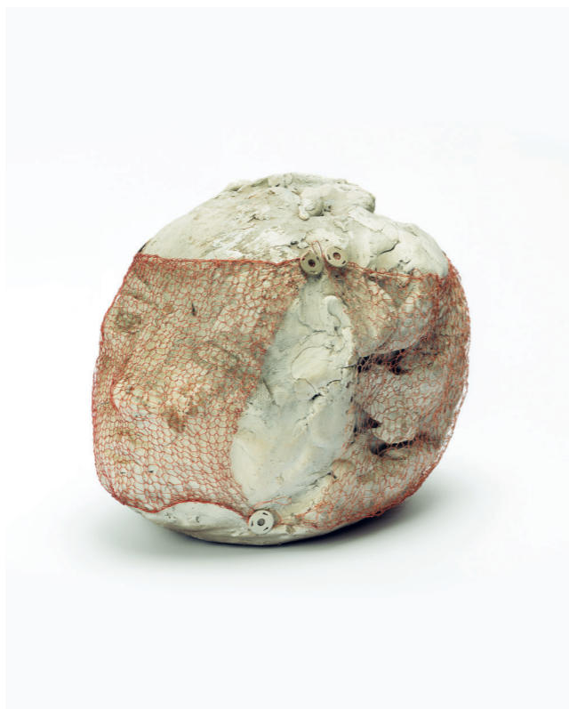
↑ Marisa Merz, Sans titre , 1982, argile crue, fil de cuivre, punaises, 17 x 16 x 22 cm, Merz Collection, photo : Renato Ghiazza © 2025, ProLitteris, Zurich

Les motifs, les couleurs et les compositions des œuvres de Marisa Merz font souvent écho à des œuvres d'art du passé : aux icônes byzantines, aux peintures religieuses de Fra Angelico et Antonello de Messine ou à la peinture